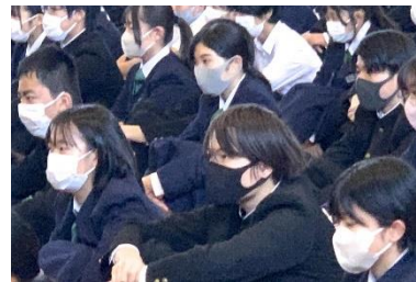
呼びかける側も受け止める側も、どちらも真剣です！

「自分たちでこの問題を解決していかなければならない」「『こういう問題が起こるのには、当事者だけでなく自分たちにも問題がある』と思っている生徒もいる」といった話から始まり、大中生が大切にしている「まもるの掟」とも関連付けながら、全校生徒への熱い呼びかけがされました。