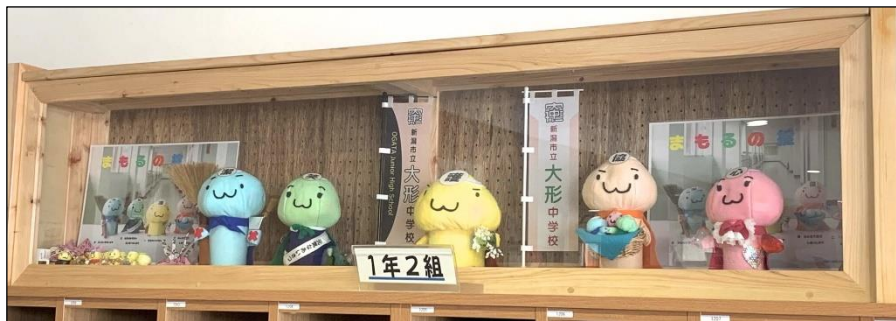
一つ一つのマスコットに込められた思いや決意を、改めて意識しよう！

生徒朝会で、先輩がつくった宣言を改めて大事にしようという呼びかけがされました。これは、いわば「原点回帰」です。月日が経つと意識が薄くなりがちになることはよくあることですが、先輩の残した思いに立ち帰り、自分たちの問題としてこれからの学校生活をつくるよりどころとしてほしいと思います。